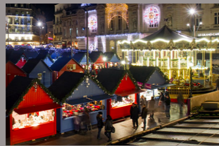
Les Soleils d'Hiver - ANGERS -

Du 29 novembre au 28 décembre Découverte du marché avec un Petit Train gratuit Place du Ralliement et rue Lenepveu 100 chalets