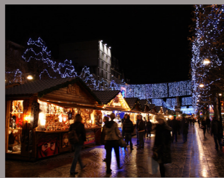
Le Village de Noël - REIMS -

Origine 1570 Christkindelsmärik Du 28 novembre au 31 décembre 2014 Plus grand Marché de Noël d'Europe 11 marchés de Noël 300 Chalets Grand Sapin de 30 mètres , Place Klébert