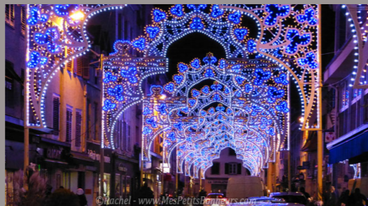
Les Lumières de Noël - MONTBÉLIARD -

Depuis 1997 Illuminations 1100 points lumineux Concours de décoration pour les Colmariens 5 marchés de Noël Place des Dominicains La Petite Venise Marché intérieur du Koïffhus Place de l'Ancienne Douane Place Jeanne d'Arc