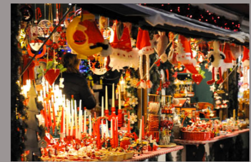
Parfums d'Hiver - AMIENS -

Du 21 novembre au 28 décembre 2014 135 chalets Crèche vivante Spectacle interactif d' automates Animations