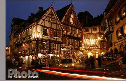
Les Grandes Illuminations - COLMAR -

Depuis 2008 Du 14 novembre au 8 janvier Champs Elysée 300 arbres illuminés 200 chalets Depuis 1994 Du 20 novembre au 28 décembre Village Noël à la Défense 12 000 m 2 300 chalets Il y a de nombreux autres marchés plus petits dans Paris