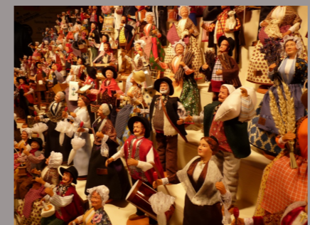
La Foire aux Santons - MARSEILLE -

Du 29 novembre au 28 décembre Découverte du marché avec un Petit Train gratuit Place du Ralliement et rue Lenepveu 100 chalets