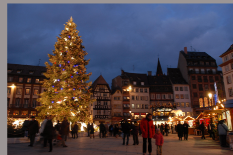
Le Marché de Noël - STRASBOURG -

Depuis 1986 Du 22 Novembre au 24 décembre 2014 60.000 ampoules Illuminations 140 chalets Au pied de la plus ancienne église luthérienne de France